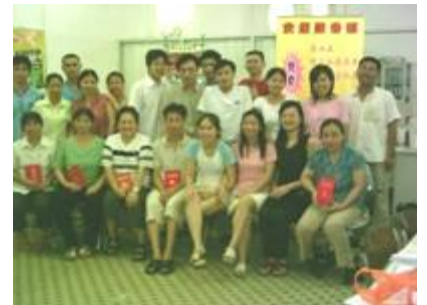
我们的“义工荣誉证书”。多开心！