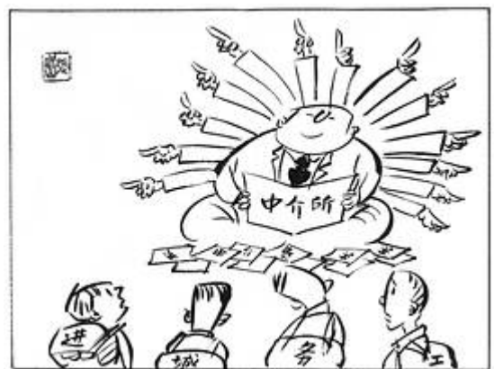
（漫画）张保山《中介所》