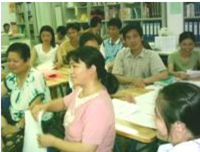
一起来讨论：怎样做个好义工