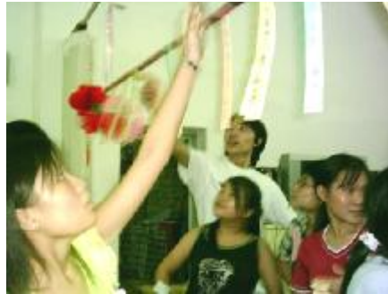
这个灯谜我猜到了! 来, 我讲个好玩的故事给大家听~~