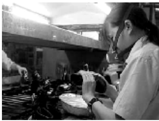
刷胶时必须戴口罩

务工人员、临时工受害尤为突出。调查表明，企业经营者安全意识淡薄，一些地方政府为了招商引资而放任职业危害和生态环境的破坏，不按规定审查验收工程项目等，这直接导致职业病高发生。比如：江苏省早就强制规定，制鞋业应使用无毒水基胶和无苯大底胶，但至今在全省 2000 多家制鞋企业中，绝大部分仍使用含苯胶。目前，江苏省作业场所高毒物品职业危害专项整治正在开展中。