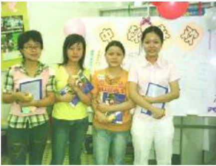
获奖者留念! 这奖品可是她们在“职安健问答比赛”中齐心协力得来的。

9月18日晚, 又是一年一度的中秋佳节, 那天上圆圆的月儿又该引得多少打工的兄弟姐妹思念起家乡的亲人了! 可是看看她们, 为什么一脸快乐, 笑嘻嘻的模样? 因为大家年轻, 所以快乐地面对生活, 面对未来, 还因为, 今晚他们第一次从佛山, 从安康快车的三个服务点汇聚到服务部来啦。这是安康快车举办的第一次活动。我们互相介绍, 玩游戏、猜灯谜、吃月饼, 还来了个“天才表演”。你看, 在分组有奖问答比赛中, 他们的手举得那么快, 那么高, 把“裁判”的眼睛都看花了。可是, 有一些简单的职安健常识题都答错啦, 真不应该。在轻松快乐的交流和游戏之余, 大家一定不要忘了提升自己的能力, 帮助更多的工友哦。