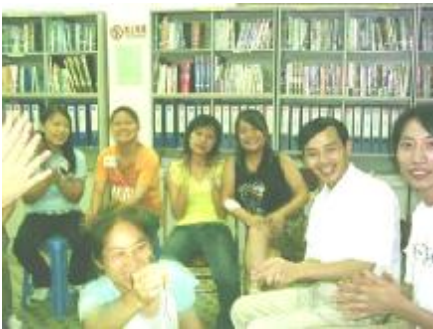
为自我介绍的新朋友鼓个掌!

9月18日晚, 又是一年一度的中秋佳节, 那天上圆圆的月儿又该引得多少打工的兄弟姐妹思念起家乡的亲人了! 可是看看她们, 为什么一脸快乐, 笑嘻嘻的模样? 因为大家年轻, 所以快乐地面对生活, 面对未来, 还因为, 今晚他们第一次从佛山, 从安康快车的三个服务点汇聚到服务部来啦。这是安康快车举办的第一次活动。我们互相介绍, 玩游戏、猜灯谜、吃月饼, 还来了个“天才表演”。你看, 在分组有奖问答比赛中, 他们的手举得那么快, 那么高, 把“裁判”的眼睛都看花了。可是, 有一些简单的职安健常识题都答错啦, 真不应该。在轻松快乐的交流和游戏之余, 大家一定不要忘了提升自己的能力, 帮助更多的工友哦。