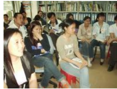
“工友聚会”——聚精会神， 集思广益，回答职安健问题~~