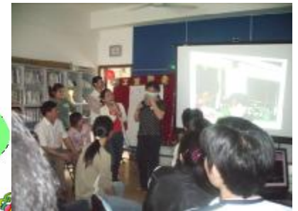
瞧，我的口罩戴得规范吧？~~