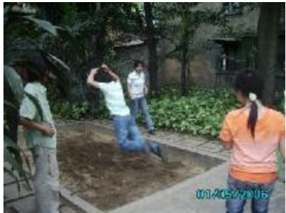
啊？这下摔惨了…… 不是啦，是立定跳远！