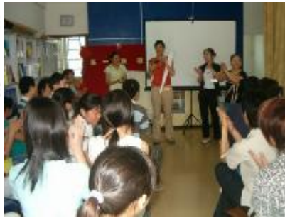
互相认识“打傻瓜” 看谁的发言最精彩！