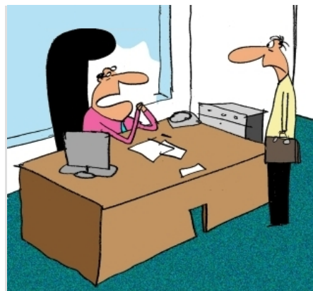
“公司打算淘汰 2000 名不合格员工。请问你能否胜任每周干 168 小时？”